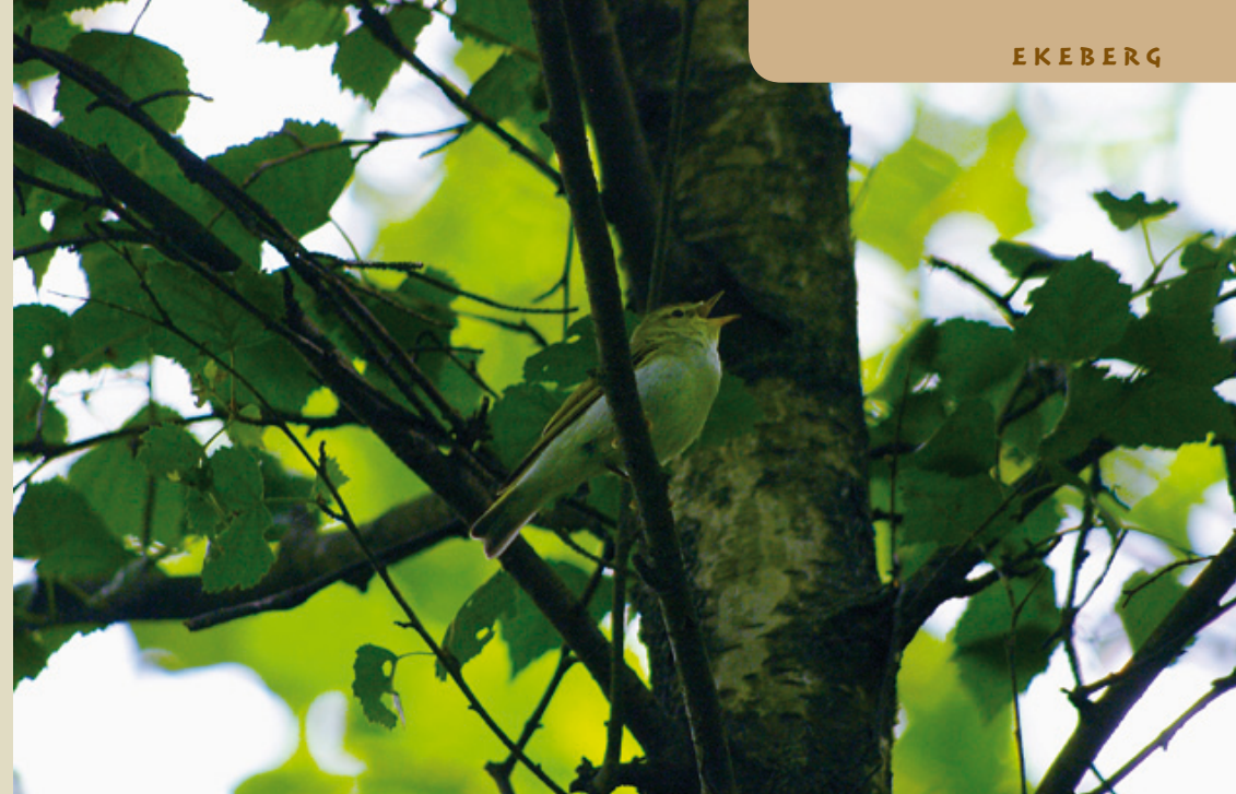
Boksanger synger flere steder i Ekebergskogen